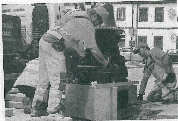
DOKONČOVACÍ práce na náměstí TGM.

Nejbližší akcí, která se na náměstí uskuteční, je promítání zápasů naší reprezentace na ME ve fotbale. V době jeho konání bude prostor kolem kašny ohraničen.