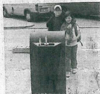
KONTEJNERY už byly použity.