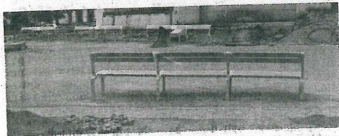
NA NÁMĚSTÍ bylo umístěno několik nových laviček.