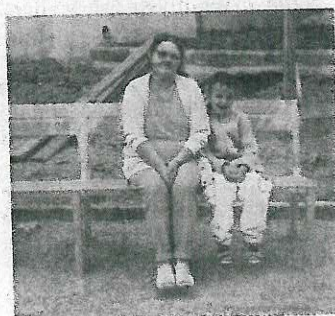
NĚKTEŘÍ zkoušeli nové lavičky.