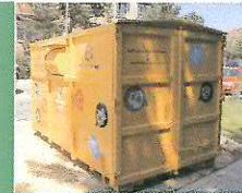
Město koupilo kontejner na textil. Je v ulici Bratří Čapků a o využití se stará Diakonie Broumov.