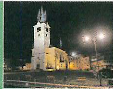
V rámci rekonstrukce náměstí TGM bylo vybudováno noční osvětlení kostela sv. Jakuba.