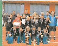
Vítězný fotbalový tým mladších žáků 1.FK Příbram - tým vyhrál letošní ročník Danone Cupu.