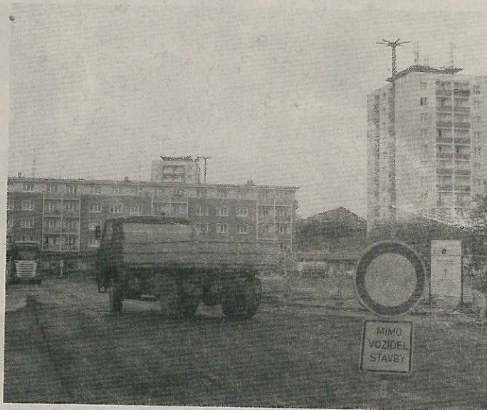
PO CELOU dobu opravy komunikace platí na náměstí zákaz vjezdu.