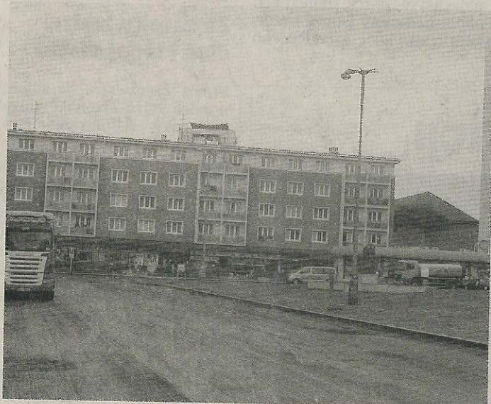
STARÝ povrch komunikace na náměstí je již odstraněný.