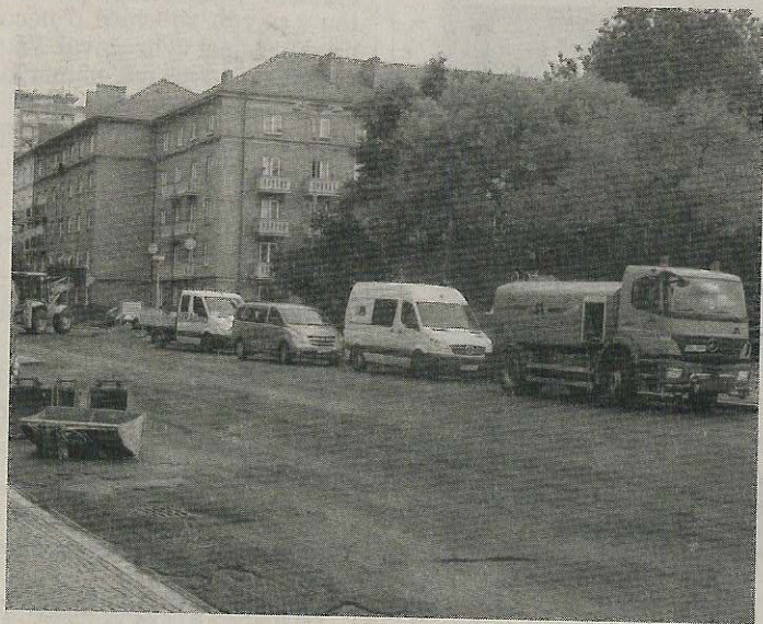
VYFRÉZOVANÁ komunikace je připravená na novou pokládku.