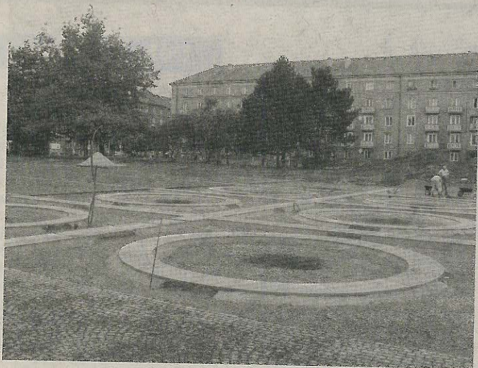
KRUHY jsou úplně nový prvek na náměstí, budou v nich růst stromy.

Ve fotogalerii je zachycený současný stav prací. (lb)