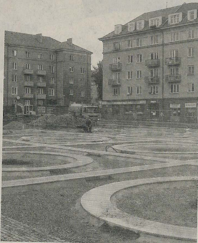
VŠICHNI jsou určitě zvědaví, jak bude tato část náměstí vypadat.