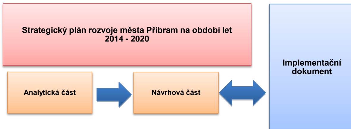
Schéma 1: Průběh zpracování Strategického plánu rozvoje města

části, která udává cíl a jednotlivé priority v oblasti rozvoje území. Stěžejním krokem je následné zpracování (nastavení) Metodiky implementace strategického plánu založené na principech prostorového plánování, které zajistí optimální fungování strategického plánu. Tento dokument obsahuje postup přípravy projektů a aktivit k realizaci strategického plánu vedoucího k rozvoji sledované oblasti. Dále popisuje zavedení zvolené strategie a kompetencí do činnosti Městského úřadu Příbram, jeho účelem je završit proces implementace nově vzniklých strategických částí do činností a chodu města.