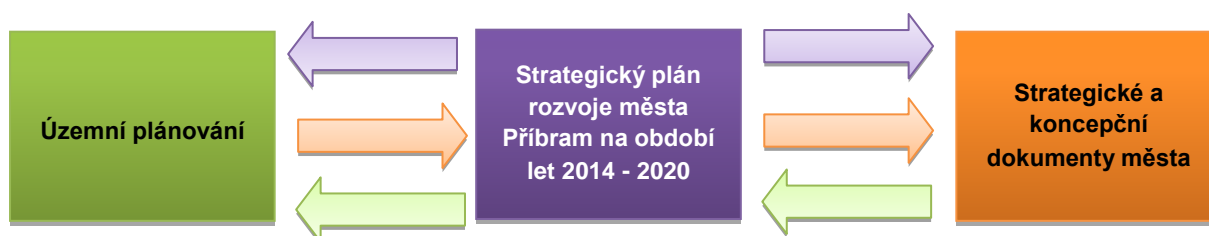
Schéma 2: Provazba koncepčních dokumentů

Jako takový má v oblasti rozvoje města důležitý charakter vzhledem ke všem plánovacím dokumentům v různých oblastech a je důležitým strategickým dokumentem. Strategický plán by měl být provázán a být v souladu s územním plánováním a ostatními strategickými a koncepčními dokumenty města (např. komunitní plánování, bezpečnostní strategie, strategie rozvoje cestovního ruchu), jak je uvedeno v následujícím schématu.