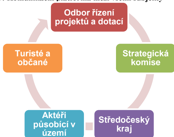
Schéma 5: Komunikační platforma mezi všemi subjekty

Komunikační platforma znamená vytvoření prostoru pro efektivní komunikaci, která bude víceúrovňová, založená na principech prostorového plánování, tzn. propojující komunikaci Odbor řízení projektů a dotací, Strategické komise, aktérů působících v oblasti, občanů města a turistů. Implementace komunikační platformy rovněž přinese doporučení pro zlepšení spolupráce s regionálními aktéry (Středočeský kraj).