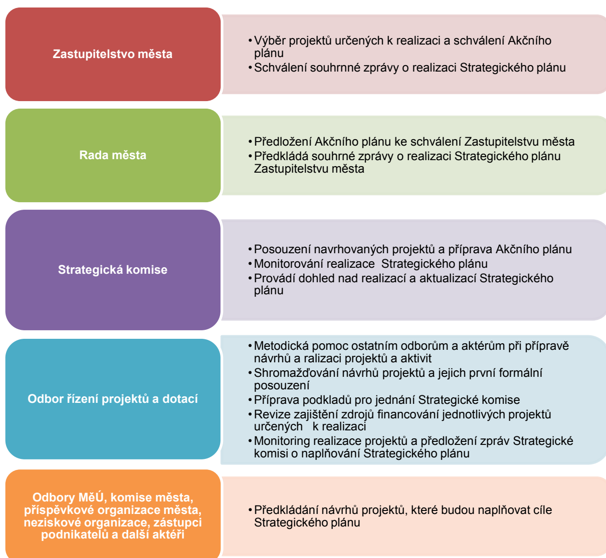
Schéma 3: Odpořednostní model implementace Strategického plánu rozvoje města Příbram

Subjekty zapojené do implementace Strategického plánu rozvoje města Příbram jsou uvedeny v následujícím schématu, přičemž stěžejními z nich je Strategická komise a Odbor řízení projektů a dotací.