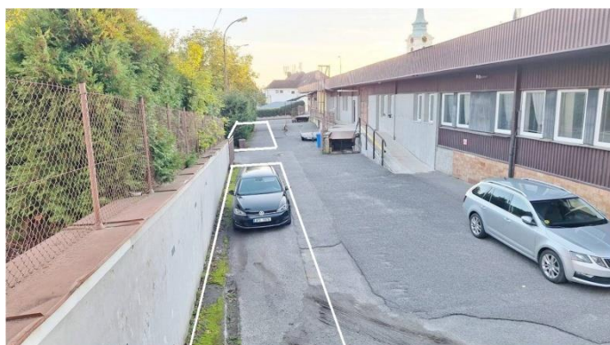
B + C