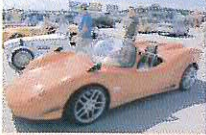
Na letišti v Dlouhé Lhotě byla k vidění tato krásná auta.