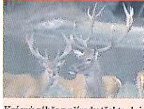
Krásný záběr z přírody těchto dnů.