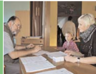
V lednu byly zápisy dětí do 1. tříd základních škol. Budoucí prvňáčci si vyzkoušeli své dovednosti.