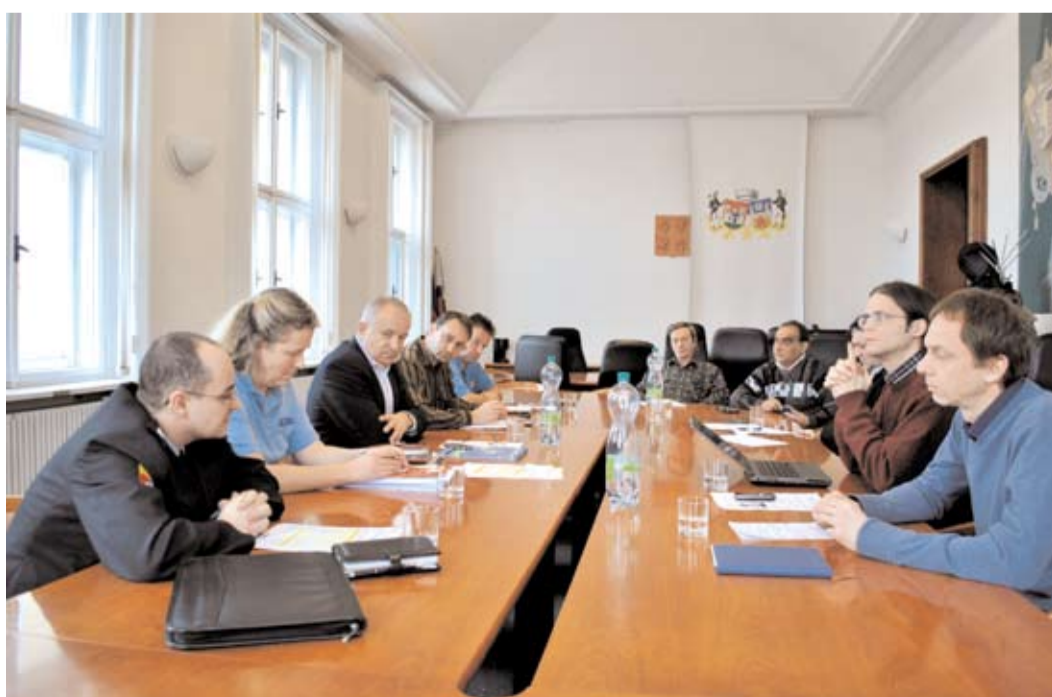
Místostarosta Václav Černý na jednání o bezpečnostní situaci ve městě.