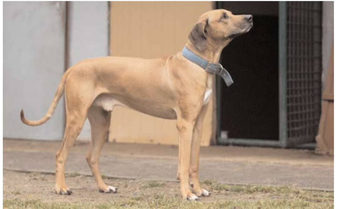
Guliver: Je asi 3-4letý ridgeback. V útulku je Guliver od 3. 1. 2014. Běhal na volno i s vodítkem a plátěným košíkem v ulici 28.října. V útulku si velice smutní po svém páníčkovi. Je čistotný a velice hodný.