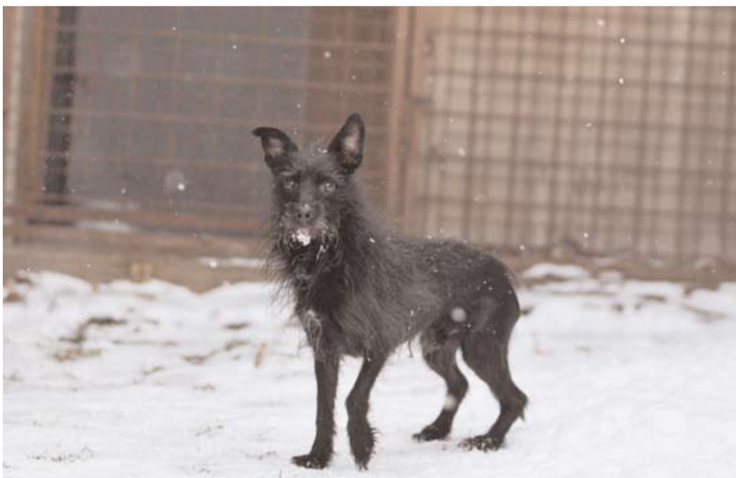
Mufík, ev. č. 240: Kříženec černého knírače. Mufíkovi jsou asi 3 roky. Je vhodný do bytu. Byl přivezen do útulku 3. 12. 2013. Je kamarádský, má rád dlouhé procházky.