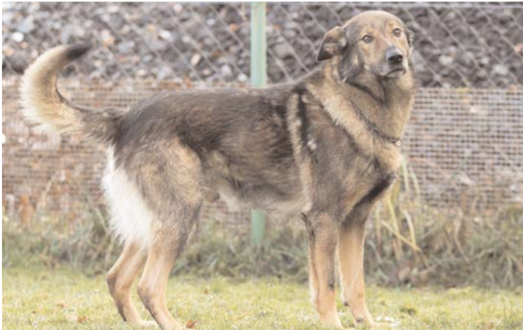
Bandita, ev. č. 237: Asi čtyřletý německý ovčák, výborný hlídač, poslušný, odchycen dne 27. 11. 2013 ve Školní ulici. Tento pes potřebuje dostatek pohybu, proto by jistě nepohrdl velkou zahradou.