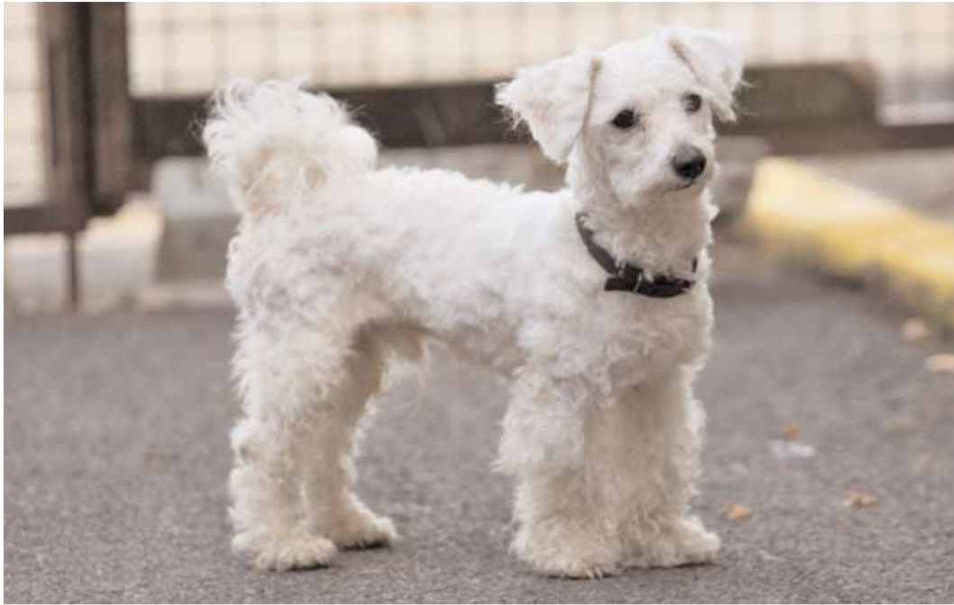
Clif, ev. č. 28: Je to kříženec bišonka, 1,5letý pejsek, hodný, vhodný k dětem. Clif by rád žil v bytě. Tento pejsek se bohužel vrátil z adopce, protože adoptivní majitel si ho ze zdravotních důvodů nemohl ponechat.