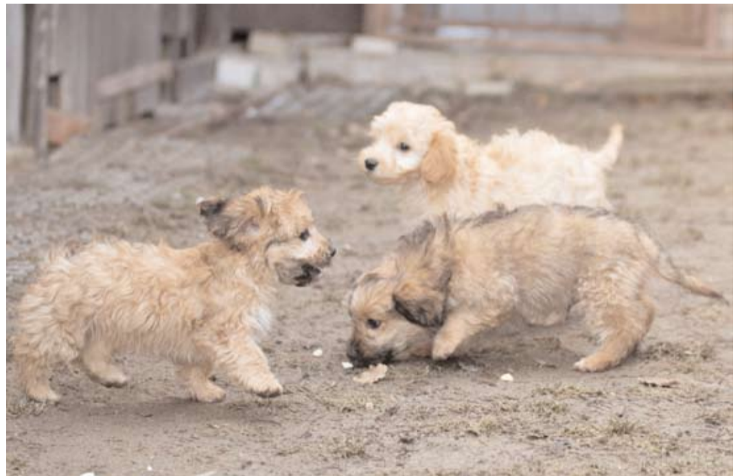
Vilík, Fík, Kačka, ev. č. 29, 30, 31: Jsou asi 2měsíční štěňátka příbramského oříška. Budou delší srsti a středního věku. Byli vyhozeni v krabici dne 7. 1. 2014 u Balonky. Štěňátka budou v době odběru očkována a odčervena.