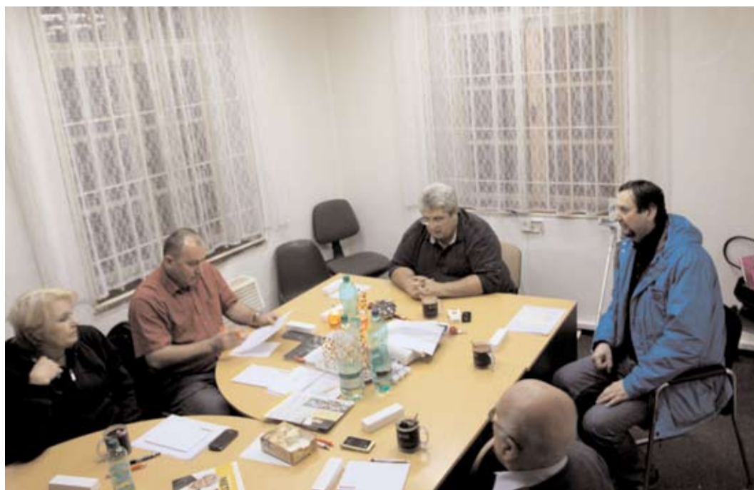
V neděli 19. 1. se sešel Klub zastupitelů ČSSD a řešil současnou bezpečnostní situaci v Příbrami.