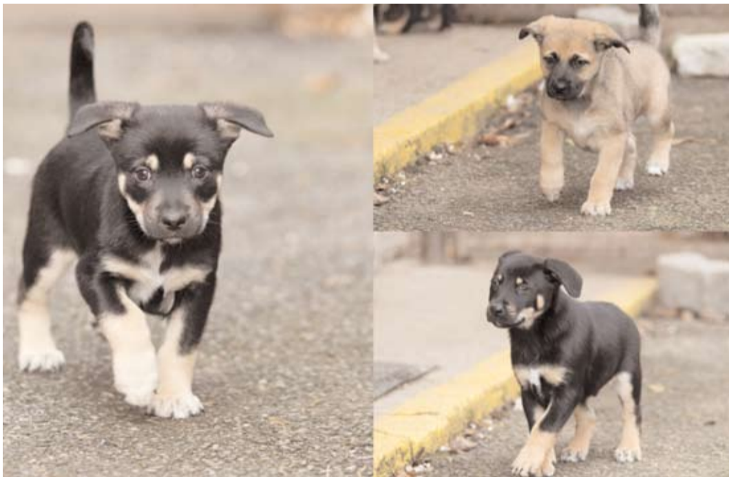
Mia, Mája, Mates, ev. č. 35, 36, 37: Jsou 3měsíční štěňátka, kříženci NO, budou středního věku. Štěňátka budou v době odběru odčervena a očkována. Dne 11. ledna je nálezce přinesl v krabici na službu MP.