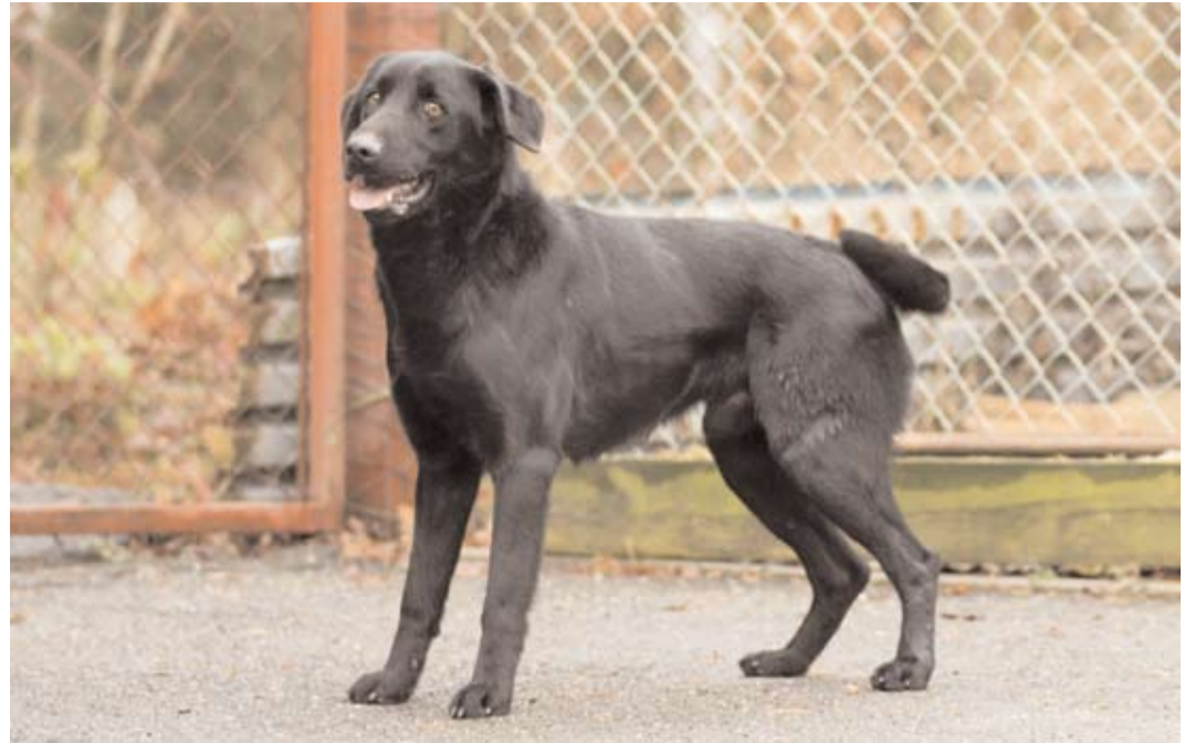
Dan, ev. č. 23: Kříženec labradora, 1-1,5letý pes. Byl přivezen z Obecnice, kde byl odchycen 2. 1. 2014. Je kontaktní, veselý povahy, vhodný i k dětem. Daníkovi by se líbila velká zahrada. Je vhodný k výcviku.