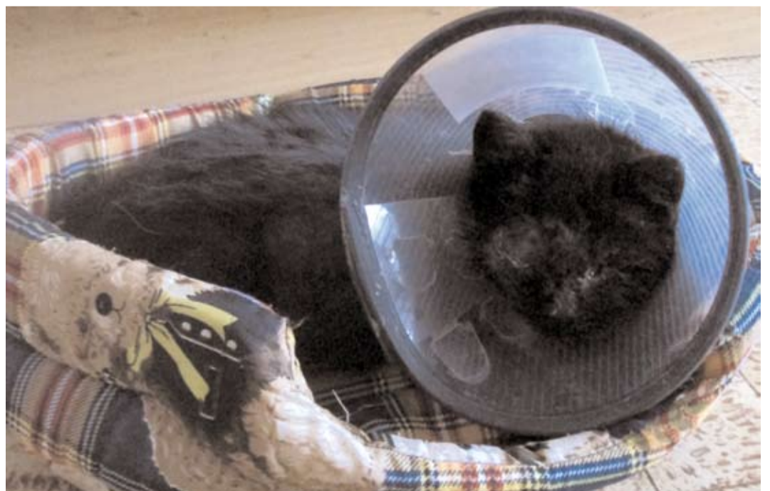
Očičko. Černý kocourek s delší srstí byl odchycen v zahrádkářské kolonii Brod s vyhrzlým očičkem (muselo mu být odoperováno), na druhé téměř nevidí. Je velmi zvědavý, přítulný, rád se mazlí a chová na klíně. Je čistotný. Bude vyžadovat větší péči, než si prozkoumá nové prostředí domova. O. s. Spolek pro kočku, tel. 731 71 71 25.