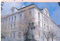
Základní škola v Jiráskových sadech oslavuje 100. výročí svého založení.

Oznámení o uzavření a omezení dopravy v Přibrami II Městský úřad Přibram, odbor správy silnic, oznamuje, že z důvodu investiční akce „Rekonstrukce a výstavby oddělné kanalizace a vodovodu v ulici Hrabáková, nám. Dr. Theurera, Mariánské údolí, Přibram II“, prováděné městem Přibram, odborem dopravy a investiční výstavby, resp. zhotovitelem stavby firmou SEFIMOTA, a. s., Praha, dojde v Přibrami II k omezení dopravy a uzavírkám místních komunikací. Stavba bude prováděna od poloviny května do listopadu 2008 a je rozdělena do čtyř etap. V 1. etapě budou uzavřeny tyto ulice: