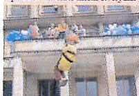
Letošní akce "Divadlo patří dětem" se opravdu vydařila. Na scéně viděti chlapečky, který se po láně dostal z holkou doh. Tuto atrakci pro děti zajišťovali příbramské dobrovolní hasiči. Divadlo A. Dvořáka patří za akce velký dík!