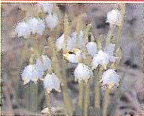
První poslové přícházejícího jara.