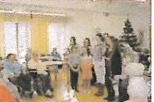
Pečovatelka služba města Přibram jako každý rokem připravuje pro své klienty vánoční setkání.