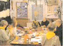
Vánoční kmenová nadílka skautského oddílu Mohawk přinesla opět radost a mnoho zážitků pro členy kmenů a jejich rodiče.

Zastupitelstvo města Přibram vyhlásuje 1. výběrové řízení v roce 2011 na poskytování půjček vlastníkům bytů a obytných budov na území města Přibram pro rok 2011 z fondu oprav a modernizace (FOM).