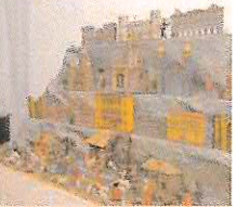
Hornické muzeum Přibram vystavovalo v Galerii F. Drtíkova v Zámečku Ernestinu bellemý.