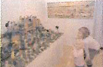
Hornické muzeum Přibram opět vystavovalo betlém. Výstava přilákala malé i velké návštěvníky.