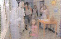
Díky studentům SZS Přibram mohly děti hospitalované v přibramské nemocnici oslavit Mikuláš.