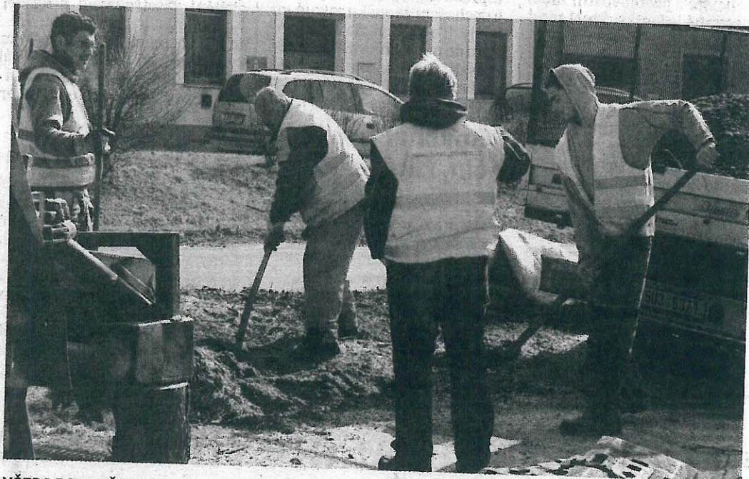
VČERA POKRAČOVALA revitalizace v Milínské ulici, kde byl poražen jeden kaštan.

Milínská ulice je pomyslnou komunikační páteří města. Je zde hustý provoz a jen málo možností výsadby. I přesto budou vedle ošetřovaných a dozívajících jírovců