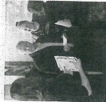
NA NAROZENINÁCH se sešli zástupci města, sponzori a medií.

Příbram – V nízkoprahovém klubu pro děti a mládež Bedna se večera sešli gratulanti, kteří blahopřáli zařízení k druhým narozeninám. Včerejší oslava rekapitulovala dosavadní působení klubu a také nabídla několik překvapení. Koordinátorka Kateřina Volfová rekla, že za dva roky se ukázalo, že Bedna má svůj smysl a navštěvují ji desítky dětí, které by se jinak potulovaly po městě. Pracovnice klubu připravily na včerejšek bohatý pro-