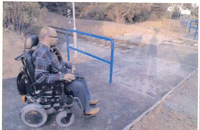
V těchto dnech je již v provozu nový přechod přes železniční trať u Junior klubu. V průběhu stavby testovali jeho sjízdnost občané s handicapem, děti na koloběžce apod.