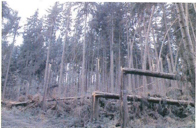
Vzhledem ke kalamitě způsobené srpnovou bouřkou byl do příbramských městských lesů vyhlášen zákaz vstupu, protože zde hrozí nebezpečí úrazu.