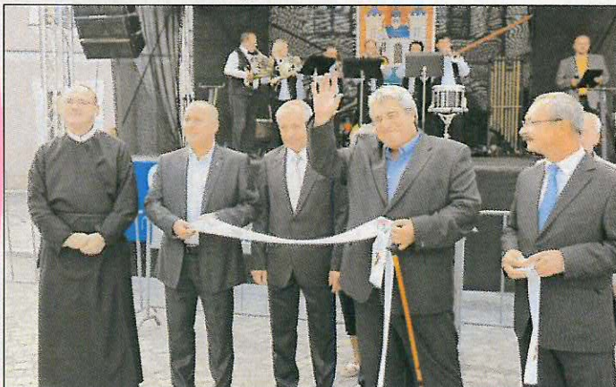
V sobotu 8. září 2012 bylo slavnostně otevřeno nově zrekonstruované náměstí T. G. Masaryka v Příbrami.

Město Příbram Vás srdečně zve na slavnostní otevření zrekonstruovaného náměstí 17. listopadu v Příbrami VII. - sobota 6. října 2012 -