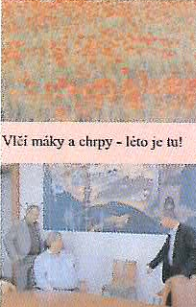
Vlčí máky a chrypy - léto je tu!

Na Prokopské pouti tradičně zahajujete některou novou expozici. Co to bylo tentokrát? „Při příležitosti 21. historické hornické Prokopské