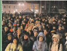
Zahájení adventu pořádalo město Příbram ve spolupráci s Radem Blank. Nechyběly ani tradiční ohňostroji.