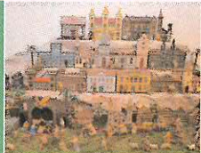
Hornické muzeum Příbram každým rokem vystavuje betlémy ve výstavních sálech Galerie Fr. Drtikola.