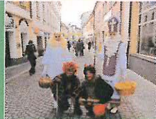
Podnikatelé z Pražské ulice připravili pro děti mikulášskou nadílku přímo na ulici. Děti dostaly drobné dárečky.