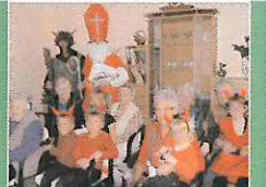
Každým rokem děti z Mateřské školy J. Drdy navštíví na Mikuláše obyvatelé sousedního DPS.