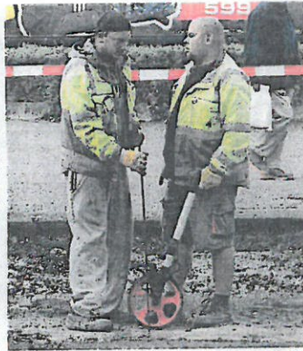
V ULICI Čs. armády řešili problém s kanalizací.