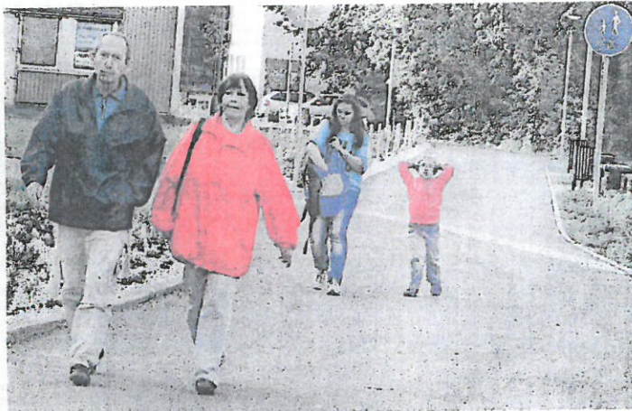
CYKLOSTEZKA je rozdělena na dvě části.

„Stávající stav jinak řešit nelze, policie umístění přechodu zamítla. Cyklostezka je tak rozdělena na dvě části, přičemž u domku končí a začíná na další straně,“ dodal k nedávno vybudované stezce podél ulice a končící u koloniálu na Rynečku vedoucí odboru.