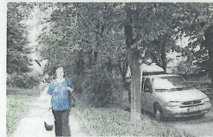
ULICE 28. října před rekonstrukcí.

V rámci rekonstrukcí místních komunikací pokračují práce také v ulicích Riegrova a Čs. Armády, k obnově povrchů dojde také v ulicích K Drkolnovu a Prokopské. (kh)