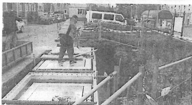
PODZEMNÍ kontejnery u II. polikliniky v Příbrami.