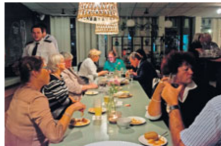
Společný večerní program.