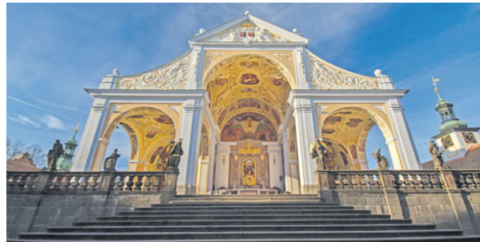
Čtrnáct let trvala Carlu Luragovi přestavba svatohorského poutního areálu.

Tentokrát si představíme osobnost, která vtiskla našemu městu nezaměnitelné panorama, když zde vytvořila hlavní dominantu města. Jedná se o architekta a stavitele poutního areálu na Svaté Hoře Carla Luraga (1615–1684).