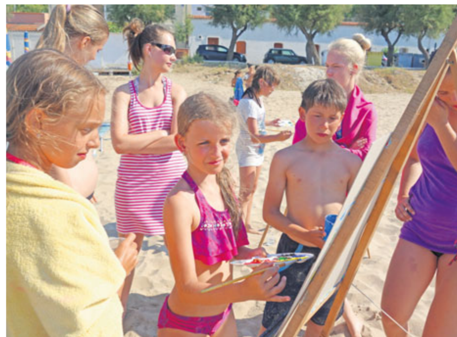
V průběhu pobytu předváděli žáci své dovednosti a výsledky dlouhodobé práce ve škole.

Na konci školního roku 2016/2017 se žáci čtvrtého, pátého a devátého ročníku Základní školy, Příbram VII, 28. října, zúčastnili výjezdu na italský poloostrov Gargano.