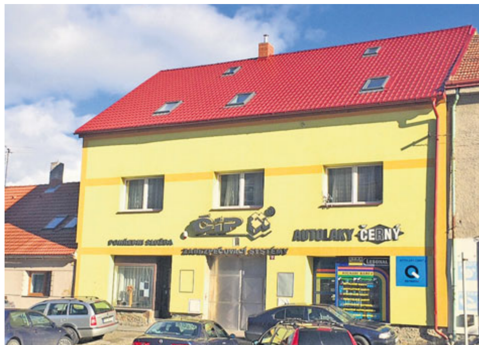
Příbramské sídlo společnosti ČIP plus.