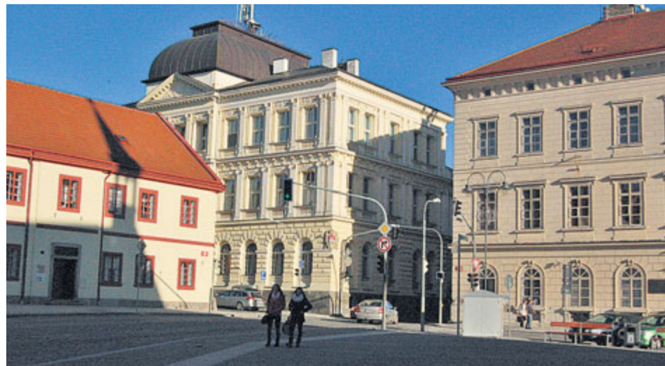
Žádosti posuzují komise, rada města a finálně o nich rozhodnou příbramští zastupitelé.

Do 30. listopadu letošního roku mohou občané, kluby, spolky a nejrůznější organizace žádat o dotace z rozpočtu města Příbram na rok 2018. K žádosti slouží speciální internetová aplikace.