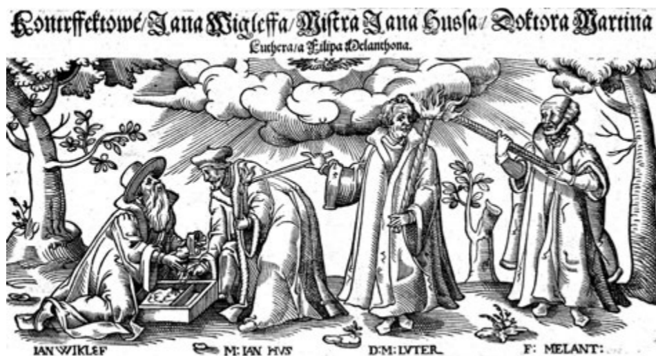
Štáta evropské reformace.

Na konci října si především protestantské církve v Evropě připomněly, že před 500 lety začal Martin Luther usilovat o nápravu katolické církve. Jeho následovníci přišli také do Příbrami, která platila za nábožensky tolerantní město s převahou kališníků. A to i po svém povýšení na královské horní město roku 1579.