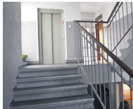
Opravené schodiště a výtah.

Ze souhrnné zprávy z kontrol Hasičského záchranného sboru Středočeského kraje (HZS) zaměřených na domy s pečovatelskou službou vyplývá, že dům s pečovatelskou službou v Hradební ulici nesplňuje podmínky protipožární normy bezpečnosti, navíc je podle této zprávy budova již od roku 1982 užívána v rozporu s kolaudačním rozhodnutím. Vedení města Příbram se touto záležitostí intenzivně zabývá a hledá východisko, jak situaci řešit. Rada města bude v této věci jednat 20. listopadu.