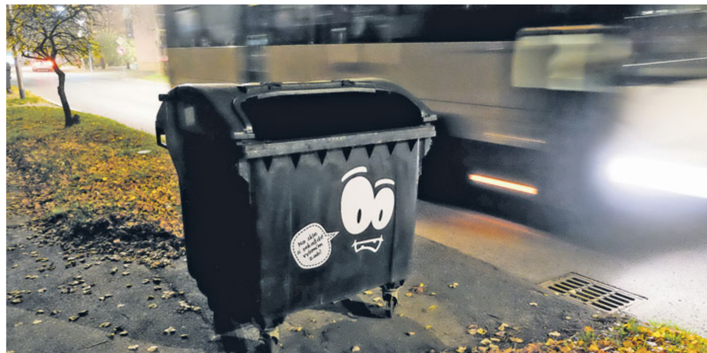
V těchto týdnech v Příbrami narazíte na „mluvící kontejnery“.

Občané, kteří třídí, nebo začnou třídít odpady, se v listopadu dočkají recyklovaných odměn díky hře Tref si svůj barevný kontejner. Do ulic města vyrazí třídicí hlídka s dárky pro každého, koho zastihne při třídění odpadů do barevných kontejnerů. U dvaceti sběrných míst v celém městě budou vyznačeny kruhy a lidé se budou trefovat vytříděným odpadem do barevných nádob. Čím více odpadů k vytřídění lidé přinesou, tím hodnotnější odměny ve hře získají.