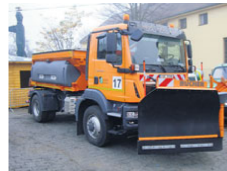
Technické služby budou letos používat nové posypové vozidlo na podvozku značky Man.

Technickým službám začalo zimní období, kdy je v případě sněhových srážek a náledí zaměstnává především úklid silnic a chodníků. Pro letošní zimu mají k dispozici dva nové stroje.