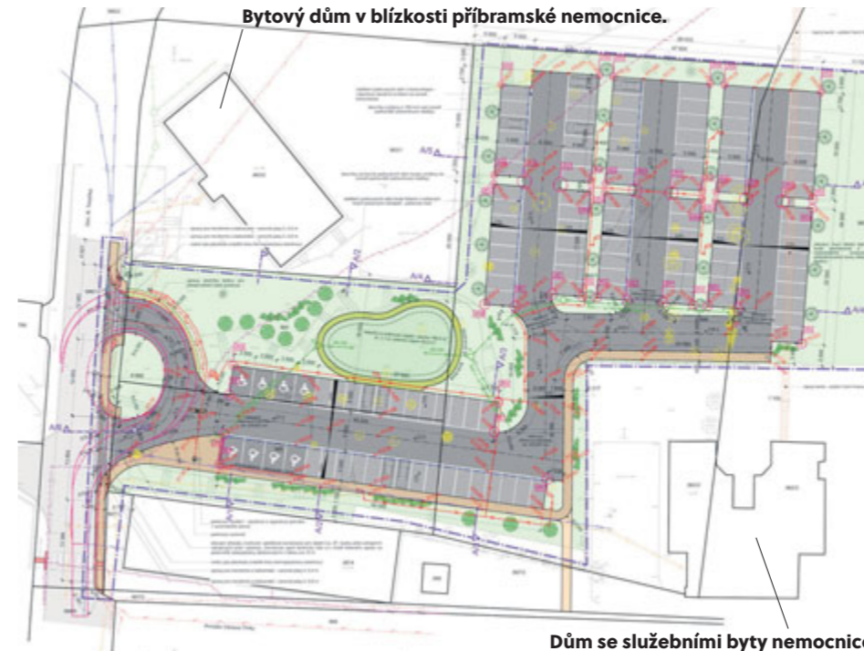
Nákres vznikajícího parkoviště v blízkosti příbramské nemocnice.