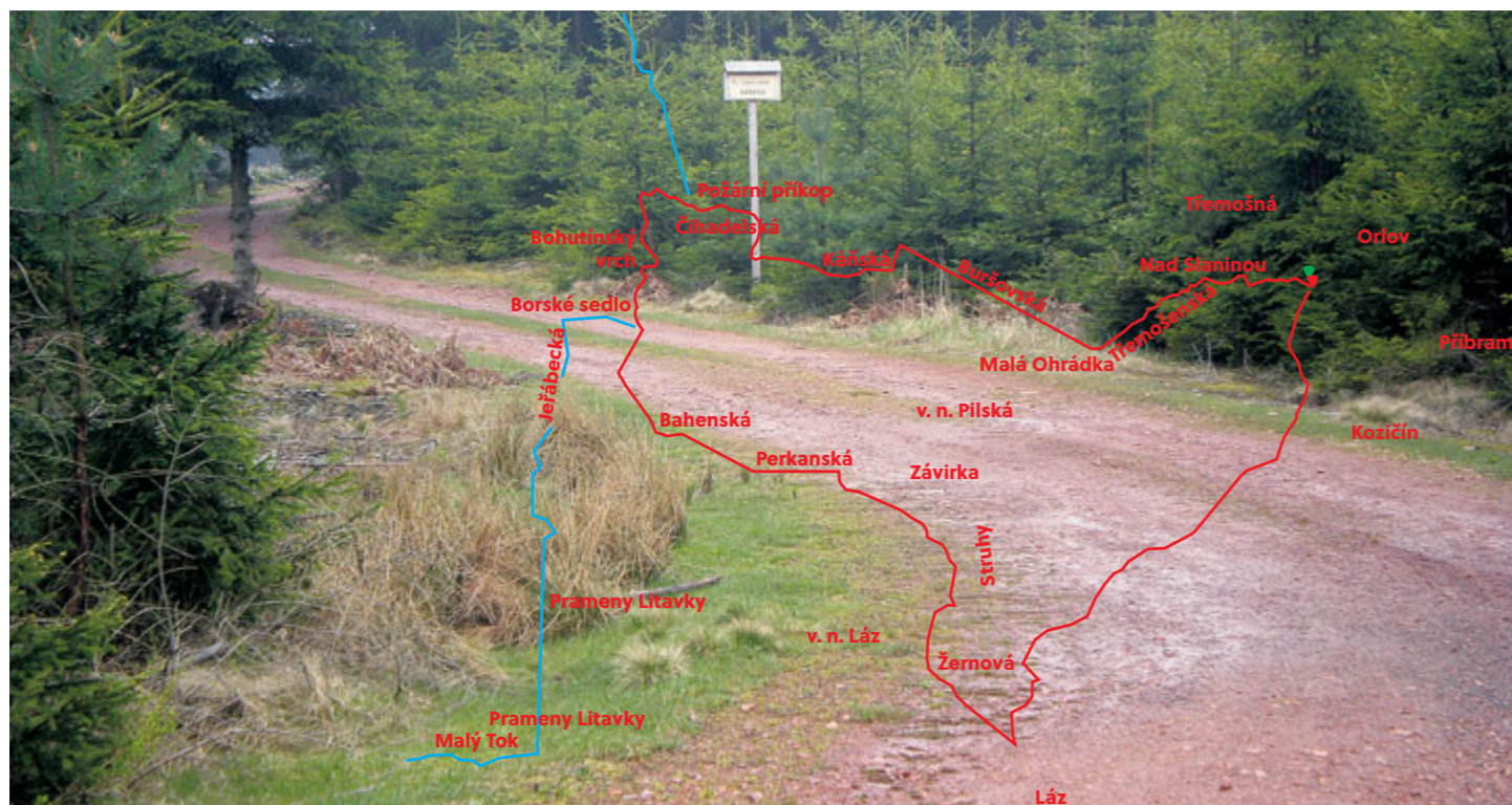
Trasa nás povede z Orlova po zelené značce po Třemošenské a Buršovské cestě až na křižovatku s Káňskou cestou (na snímku).

Vojenské lesy a statky jsou ochotny vyjít vstříc lyžařům a vybrané cesty v Brdech neprohrnovat (nebo jen opatrně) a nespát. Proto vám nabízíme výlet ve stopě jednoho z připravovaných lyžařských okruhů, které budou moci využít běžkaři už tuto zimní sezónu.