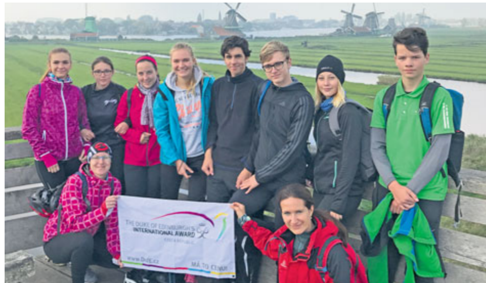
Společná fotografie s tradiční holandskou krajinou v pozadí.

DofE, tedy hezky česky Mezinárodní cena vévody z Edinburghu, funguje na našem gymnáziu již spoustu let. Je to program, který se zaměřuje na osobní růst mladých lidí.