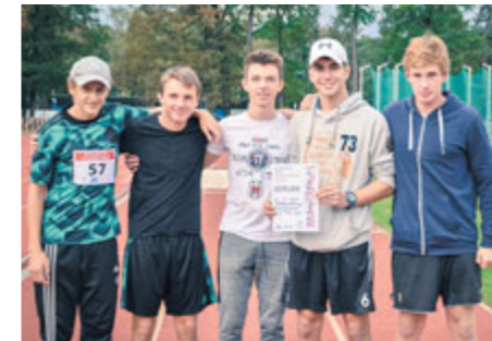
Březohorští žáci postoupili v atletickém čtyřboji do krajského finále ve Staré Boleslavi.

Žákům ze Základní školy na Březových Horách se velmi daří ve sportovních soutěžích, které probíhají na úrovni příbramského okresu i Středočeského kraje. Úspěchy sklízí v atletice, běhu i fotbale.