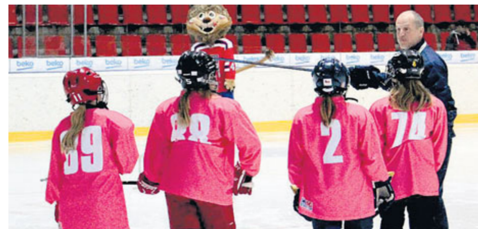
Světový víkend dívčího hokeje přilákal nejvíce hokejistek právě v Příbrami.

Na příbramském zimním stadionu se v posledních týdnech uskutečnilo hned několik zajímavých akcí, v nichž hlavní roli hrají hokejka a puk. Sportovní zařízení města Příbram plánuje podobné akce podporovat i do budoucna.