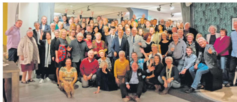
V Hoornu panovala dobrá nálada.