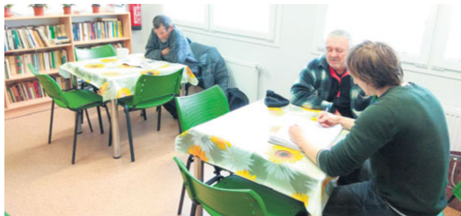
Denní místnost slouží nejen k občerstvení a odpočinku, ale také se zde vyřizují administrativní záležitosti klientů.

V poměrně nedávno otevřeném zařízení v ulici Čs. armády sídlí středisko CSZS s názvem Nízkoprahové denní centrum a Noclehárna (NDCaN). Jak již sám název napovídá, jedná se o dvě oddělené služby. Obě dvě jsou tzv. ambulantní. To značí, že nejsou určeny k trvalému užívání, ale jejich klienti je využívají nárazově a v případě potřeby.