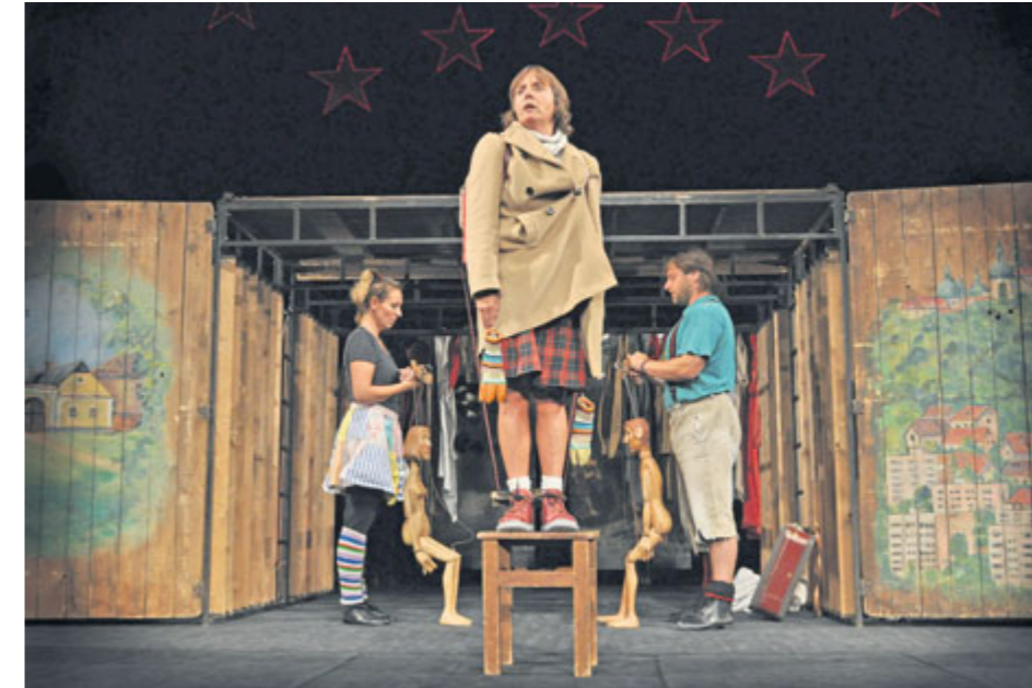
Hrdý Budžes patřící dlouhodobě k nejúspěšnějším představením příbramského divadla.

Divadlo A. Dvořáka Příbram je příspěvková organizace města s vlastním hereckým souborem, pod kterou spadají tři scény – velká, malá a klubová. Vlastní nabídku ještě rozšiřuje o dovozová představení a koncerty.