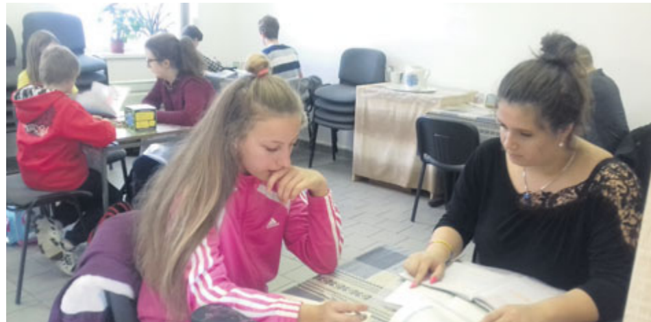
Dobrovolníci přicházejí z obou místních gymnázií a obchodní akademie.

Některé děti to s učením nemají lehké. Od loňského roku si v příbramském dobrovolnickém centru společnosti Adra mohou najít kamaráda, který jim s učením pomůže.