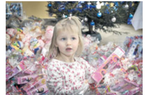
Každoroční Vánoce v divadle.