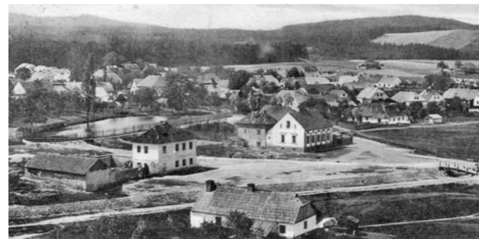
Mlýn na drcení stříbrné rudy se nacházel v Podlesí.

Cesty rodů, jimž se v této rubrice věnujeme, jsou často spleť. V následujícím článku přiblížíme dva zajímavé rody Jelínků z Příbrami, které však nejsou jedné krve.