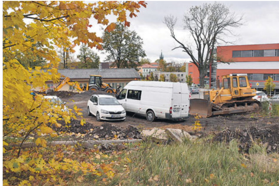
Parkoviště vznikne na ploše přibližně 3500 m 2 .

Nové parkoviště u nemocnice pojme více než 120 vozů, zajíždět sem bude i autobus městské hromadné dopravy. Odstavná plocha by řidičům měla začít sloužit v únoru příštího roku.