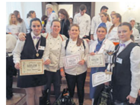
Studentky ISŠ HPOS Příbram nenašly ve Vlašimi přemožitele.

Integrovaná střední škola hotelového provozu, obchodu a služeb Příbram se stala absolutním vítězem XI. ročníku O pohár blanických rytířů.