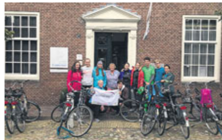
V Amsterdamu se jezdí na kole všude.

Ve čtvrtek jsme se probudili do deštivého rána a předpověď nebyla příliš optimistická. Nakonec jsme se rozhodli, že nejsme z cukru, vyndali nepromokavé oblečení a vyrazili opět na celý den na kolo. Tentokrát na druhou stranu: vodní hrad Muiden a Naarden. A stálo to za to. Po hodině přestalo pršet a užívali jsme si jízdu typickou holandskou krajinou, plnou zelených pastvin a pasoucích se krav. Naarden je krásné malé městečko, kdysi vojenská pevnost, nás však zajímalo Comenius muzeum. Zhlédli jsme film o Janu