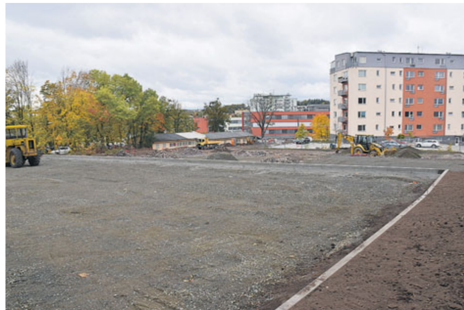
Nová parkovací plocha je na dohled od nemocnice.