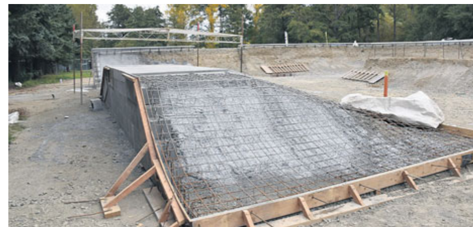
Rozestavěný skatepark na Novém rybníku.

Skateboardisté a bikeri si nové hřiště na Novém rybníku plně užijí až na jaře. Už nyní se však v těsné blízkosti otvírá nové multifunkční hřiště, kde lze hrát basketbal, volejbal i malou kopanou.