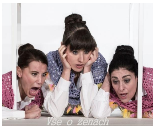
Vše o ženách