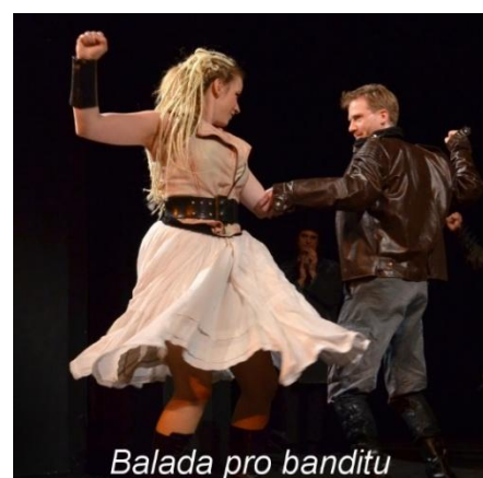
Balada pro banditu

Nezanedbatelnou část programu tvoří i představení jiných divadel, především pražských. Divadlo je také pořadatelem koncertů nejrůznějších hudebních stylů.