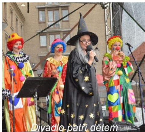
Divadlo patří dětem