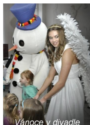
Vánoce v divadle

Divadlo je také pořadatelem přehlídky divadel malých forem „Podzim na Malé scéně“ a pravidelně hostuje na venkovních scénách v řadě měst.