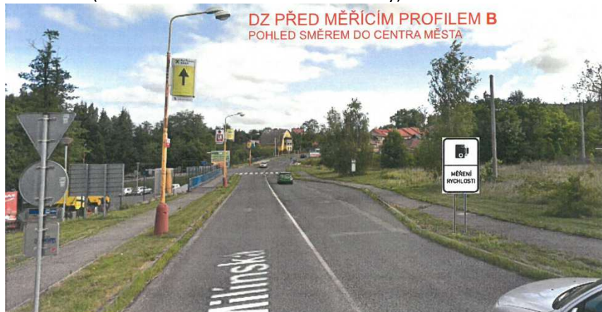
DOPRAVNÍ ZNAČKA IP 31a, V ROSTLÉM TERÉNU

Situace č.4.(umístění DZ IP 31a u okružní křižovatky):