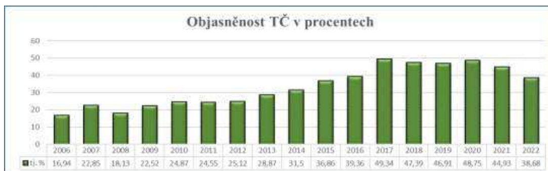
Graf č. 3 – Objasněnost trestných činů

V roce 2023 se podařilo objasněnost trestných činů opět vrátit nad hranici 40 %, přičemž celková objasněnost byla ve výši téměř 43 % , což s ohledem na množství internetových podvodů a obecně kyberkriminalitu v prostředí internetu a velmi malé možnosti zjistit osobu pachatele takového jednání, byl velmi dobrý výsledek. V této oblasti bylo Obvodní oddělení P ČR v Příbrami jedno z nejlepších v rámci celého Středočeského kraje.