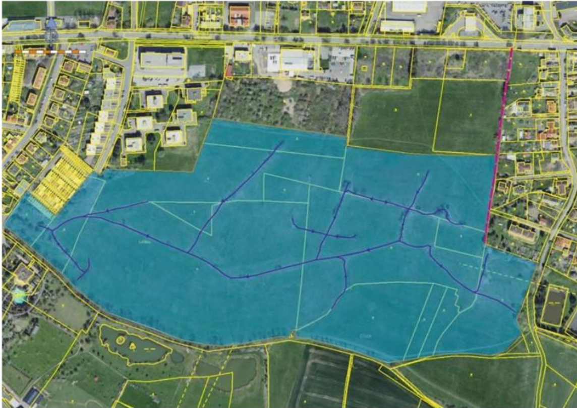
Obr. 40: Jižní polygon - Parcely dotčené mokřadem s vyznačením průběhu drenážního systému (modře) a rýhy (červeně) přivádějící srážkovou vodu z prostoru ulice Žižkova.